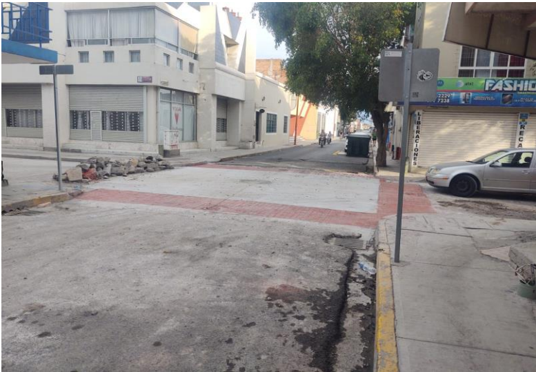
PAVIMENTO DE CONCRETO Y ESTAMPADO EN PASO PEATONAL EN BOCA CALLE DE DOBLADO ESQ. HIDALGO

SE TERMINA DE COLOCAR CONCRETO Y ESTAMPADO EN CRUCES PEATONALES EN LA BOCA-CALLE DE HIDALGO ESQ. DOBLADO. SE CALAFATEA JUNTAS EN CONCRETO DE ARROYO.