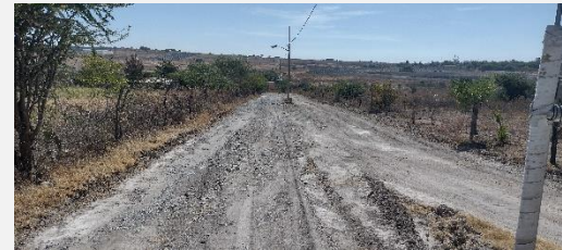
CAMINO ACCESO NO.02