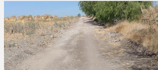
CAMINO A SAN BARTOLO