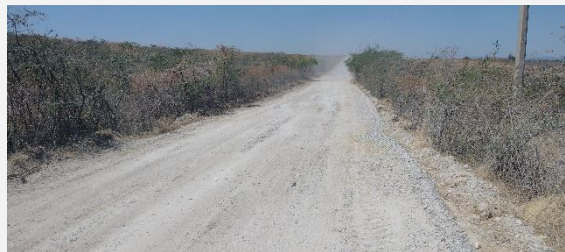
CAMINO A BARRERA DE LOS GAMIÑOS