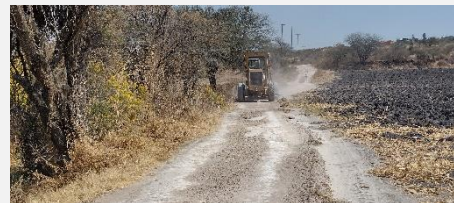
CAMINO A SAN ANTONIO EL ALTO