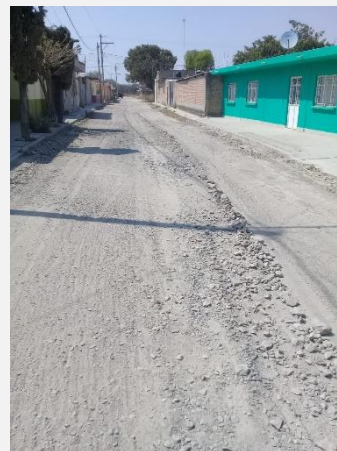
CALLE SAN IGNACIO