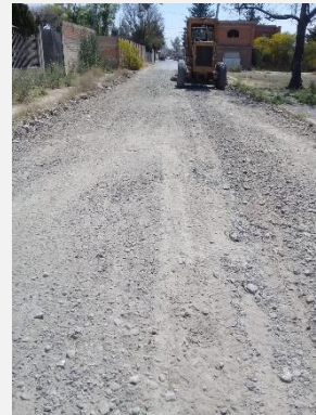
CALLE VICENTE GUERRERO