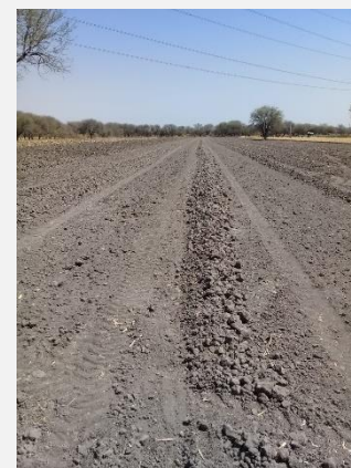
CARRIL PARA CARRERAS DE CABALLOS