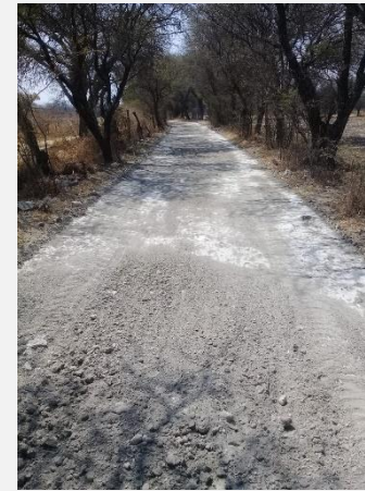
CAMINO A LAS AMAPOLAS