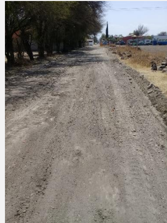
CALLE ELIAS PEREZ