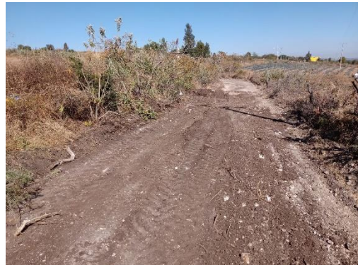
CAMINO DE ACCESO A CASAS FRENTE A PANTEON DEL SAUZ ARMENTA