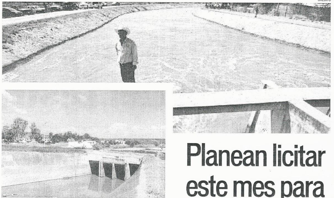
II Se estima que la inversión para las obras del canal Antonio Coria podría ascender a 40 millones de pesos.