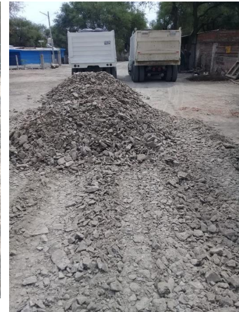
CALLE LOPEZ MATEOS SUR