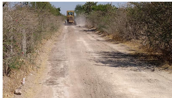
CAMINO AL JARALILLO