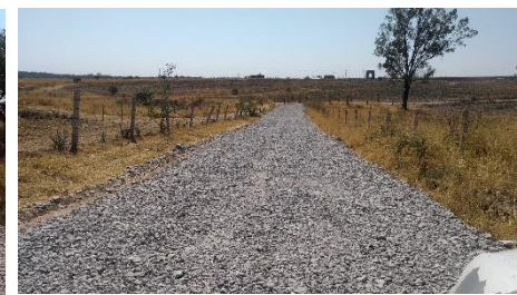
CALLE JUAN JOSE TORRES LANDA