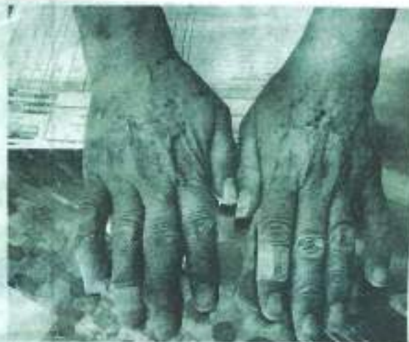
Gel. Sufre resequedad, lesiones y despellejamiento en las manos.

Sin embargo, sus actividades también involucran el contacto con otros productos de