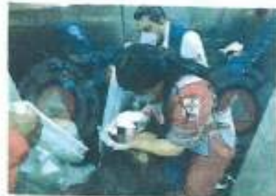
Parto. Las oficiales apoyaron a la mujer a dar a luz y paramédicos la trasladaron al hospital.