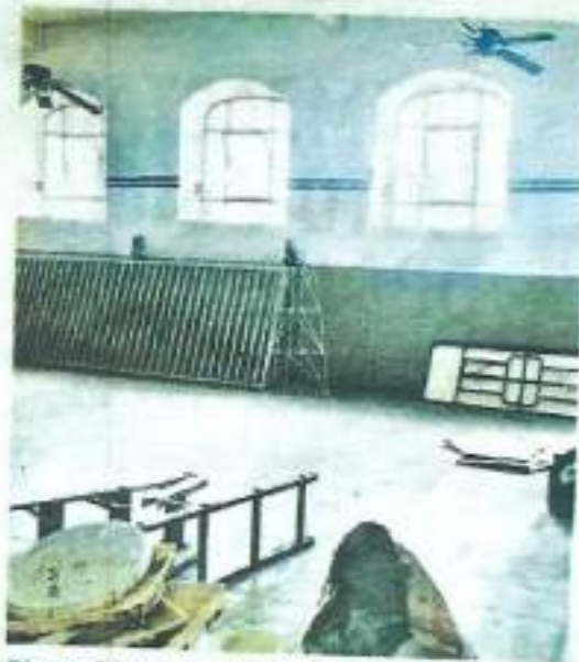
Obras. Prevén que quede listo a finales de enero.

Motivo por el cual tuvo que ser clausurado, luego del dictamen por parte de autoridades municipales; se colocaron vallas y cinta amarilla además de cerrarse con candado.