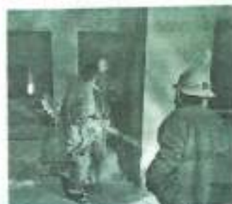
Combaten. Bomberos sofocaron el fuego.