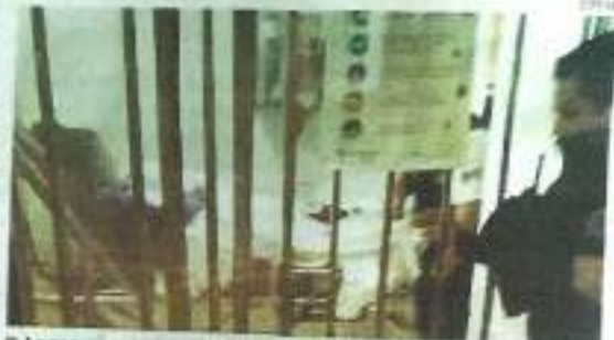
La pequeña nació en los sanitarios del mercado y posteriormente ella y su madre fueron trasladadas al Hospital Comunitario.