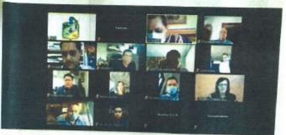
EL AYUNTAMIENTO de San Francisco del Rincón aprobó con 11 votos el proyecto de reformas, adiciones y derogaciones al reglamento de establecimientos comerciales y de servicios.