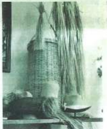
EN SAN FRANCISCO del Rincón se produce el 80% de la industria sombrerera nacional.

Haza honrar a quienes con sus manos y su sudor han abierto el paso hacia un futuro más abundante, el centro cultural 'Ruta del Sombrero' alberga un espacio, llamado 'El Zapateo de la Sedocera', ubicado en la Callejuela de Mago esquina Calle Juárez ahí es posible observar los materiales y procesos que eran utiliz-