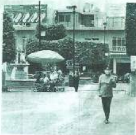
Coronavirus. Ayer San Francisco tenía 53 casos en investigación.

También son 34 en investigación y 1 paciente más recuperado, llegando a 426, y son 33 muertes.