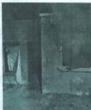
Humo. Salía bastante humo de la casa.

De acuerdo a versiones en el lugar, las llamas comenzaron a generarse dentro de la vivienda y el humo comenzó a ser visible por los vecinos, por lo que pidi-