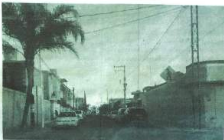
Balazos. Lo llevaron al hospital; a los atacantes no los encontraron.

El joven estaba cerca de su casa en Infonavit del Valle cuando hombres a bordo de una moto le dispararon