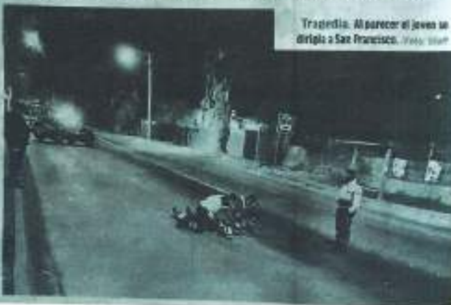
Tragedia. Al parecer el joven se dirigió a San Francisco.

• De la madrugada se registró el accidente