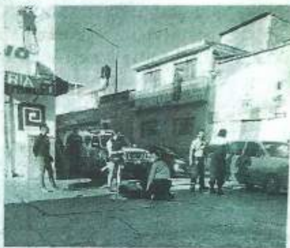
Caída. El motociclista fue hospitalizado por los golpes que presentó.

De acuerdo a versiones en el lugar, presuntamente el motociclista se impactó contra un auto que cruzaba la calle, provocando que cayera, quedando