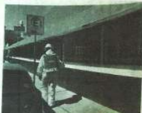
COVID. Anallzan 9 posibles contagios.

Se informó también de dos nuevos contagios y son ya 256 positivos acumulados, con 9 en investigación y se mantienen 215 recuperados.