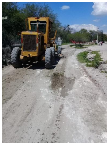
CALLE SAN JOSE