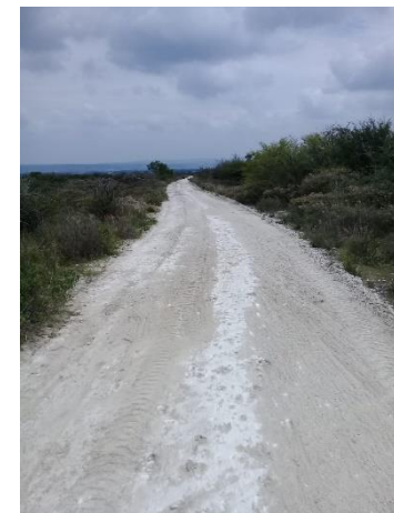
CAMINO A LOS SAPOS