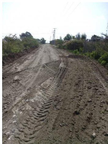
CALLE SANTA CRUZ