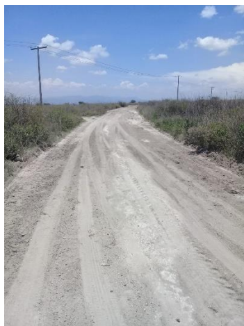
CAMINO AL PEDREGOSO