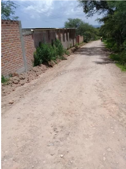
CAMINO PRINICIPAL FRANCISCO VILLA