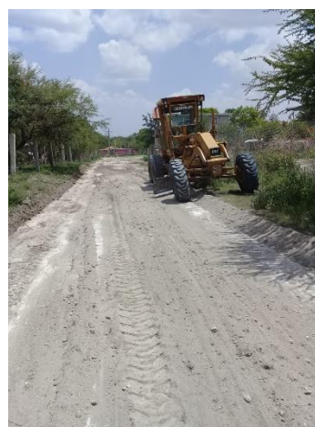
CALLE LA CRUZ