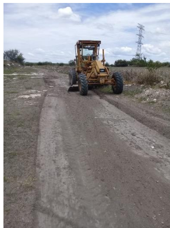
CAMINO A NUEVO JESUS DEL MONTE