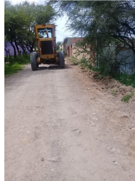
CALLE FRANCISCO I MADERO