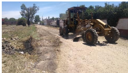
CALLE MARIA DEL RAYO