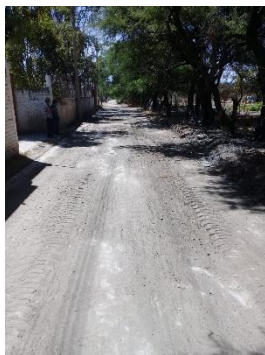
CALLE MIGUEL ANGEL