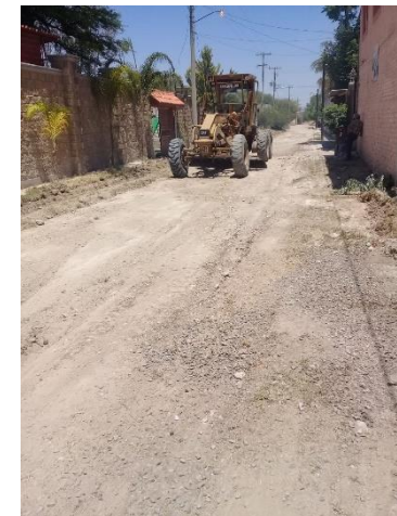
CALLE MARIA DE LA CRUZ