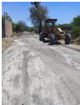
CALLE MARIA GUADALUPE