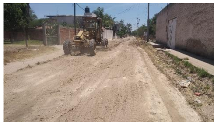
CALLE MARIA DEL CARMEN