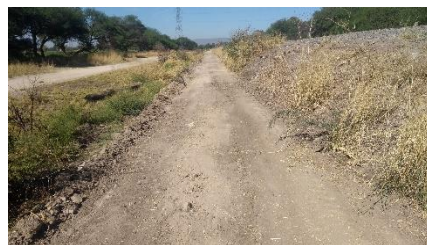
CAMINO A LA ESTACION