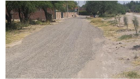
CAMINO DE ACCESO