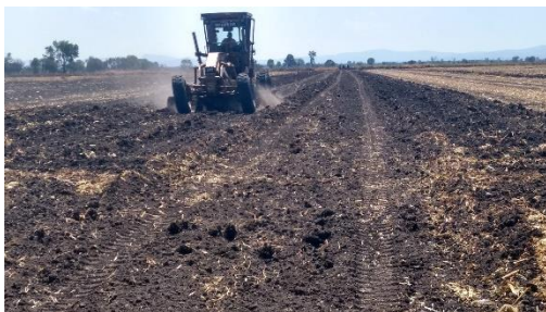
CARRIL PARA CARRERAS