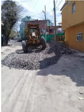
CALLE HACIENDA DE SANTA MARIA