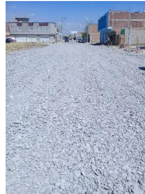
CALLE PEDRO NICOLAS