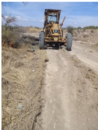
CAMINO DE ACCESO