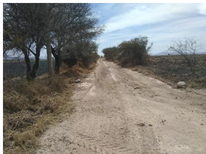
CAMINO A RANCHO DE DAVALOS