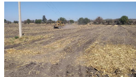
TERRENO PARA RODEO