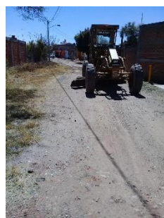
CALLE BENITO JUAREZ