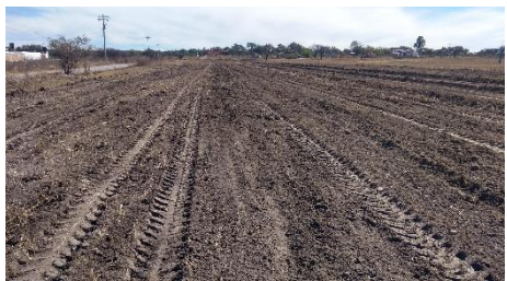
ESTACIONAMIENTO PARA FIESTA