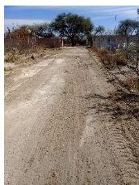
CALLE LUCIO ALCALA