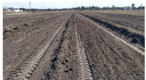
CARRIL PARA CARRERAS DE CABALLOS