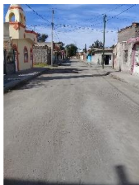
CALLE SAN IGNACIO