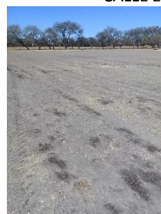
CAMPO DE BEIS BOL