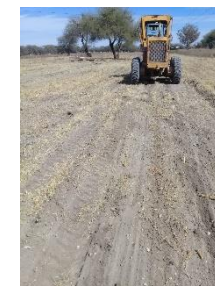
TERRENO PARA RODEO