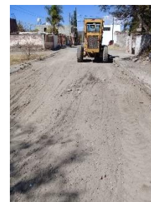
CALLE ELIAS PEREZ