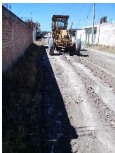
CALLE MIGUEL HIDALGO