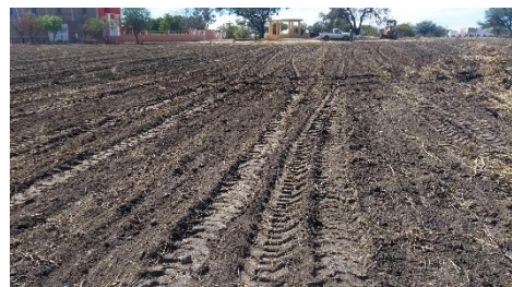
TERRENOS DE COSTADOS DE TEMPLO