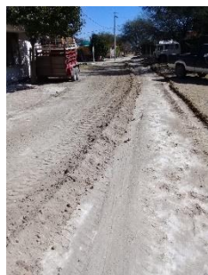
CALLE JOSEFA ORTIZ