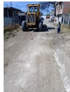
PRIVADA LUCIO ALCALA