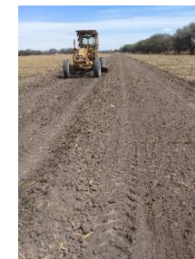
CARRIL PARA CARRERAS