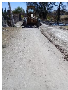
CALLE VICENTE GUERRERO