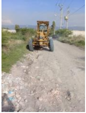
CALLE EMILIANO ZAPATA