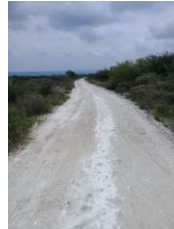
CAMINO A LOS SAPOS