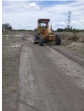
CAMINO A NUEVO JESUS DEL MONTE