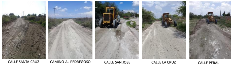
CALLE SANTA CRUZ