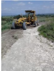
CAMINO A SANTA TERESA DE LOS SANCHEZ