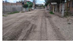
CALLE MATIAS ROMERO