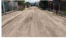
CALLE JUSTO SIERRA