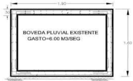
CORTE TRANSVERSAL DE EXISTENTE

POR OTRO LADO Y SIGUIENDO CON LAS MEJORAS DERIVADAS DE LA REVISIÓN POR EL ÁREA TÉCNICA DE LA CEAG EN CUANTO EL TRAZO QUE ES POR UNA VIALIDAD (CALLE TRES MARÍAS) Y QUE EN LA ACTUALIDAD TIENE UN TRANSITO CONSTANTE, DETERMINAN QUE ESTA ESTRUCTURA FUERA PARA TRAFICO VEHICULAR MOTIVO POR EL CUAL SE SOLICITO AL PROYECTISTA TOMAR ESTAS RECOMENDACIONES 3ra ETAPA ESTA CONSIDERADA A EJECUTARSE EN UN MEDIANO PLAZO YA QUE POR LA MAGNITUD DE LA OBRA Y EL COSTO QUE REPRESENTA SE TIENE QUE PROGRAMAR LA INVERSIÓN CON APORTACIONES: FEDERAL $ 37, 326, 784.13 MUNICIPAL $ $ 37, 326, 784.13 INVERSIÓN TOTAL $ 74,653,568.260