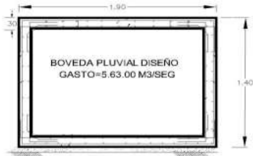
CORTE TRANSVERSAL DE BOVEDA PROYECTO